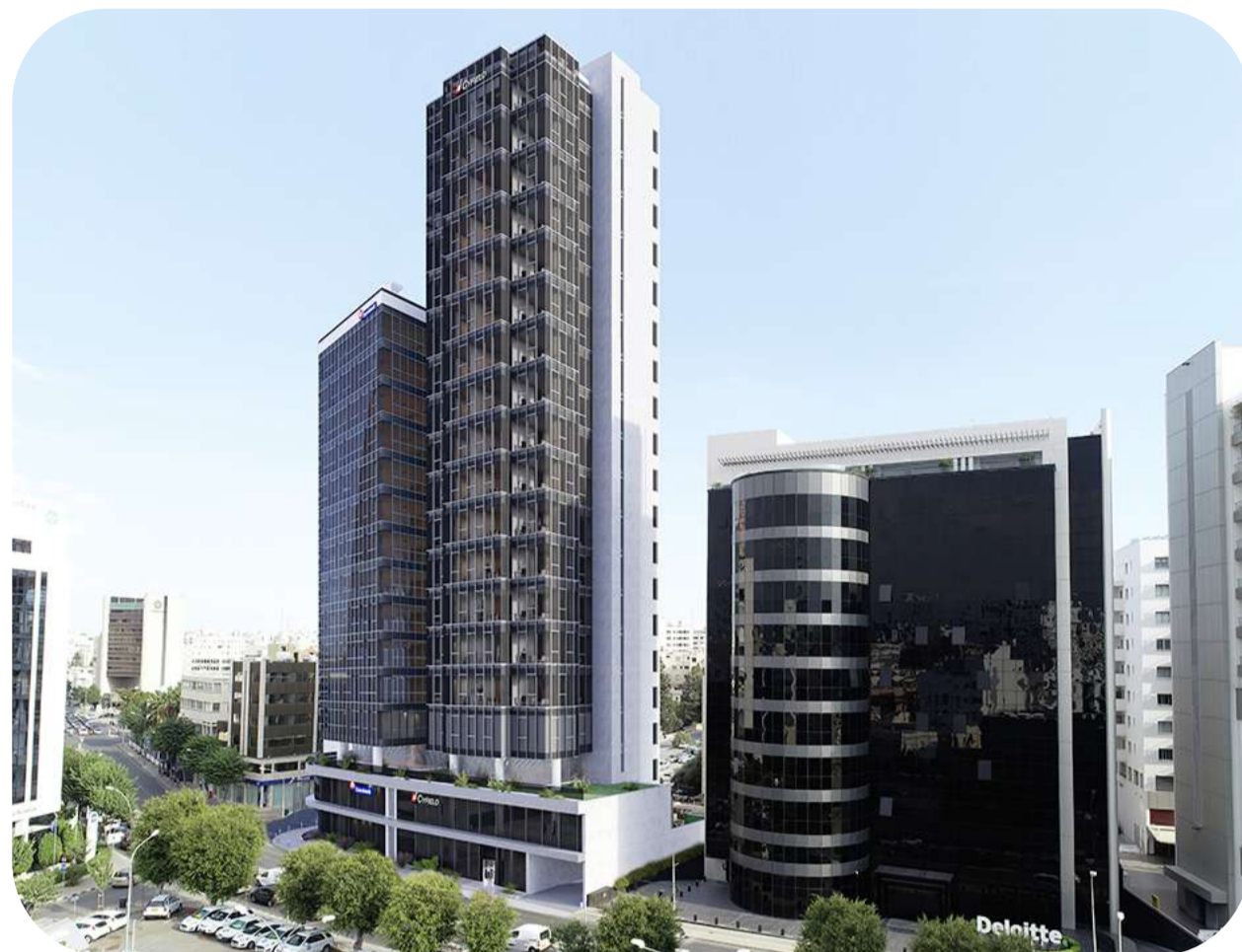
Коммерческая недвижимость в современном бизнес-центре