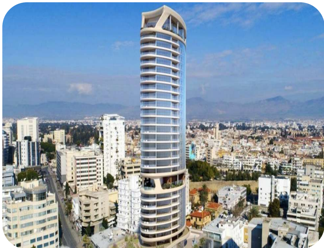
Апартаменты и коммерческая недвижимость в небоскрёбе